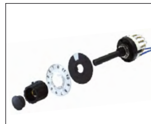
Conmutador para selección 12 grupos desde 5 setpoints. Selector switch for 12 groups selection by 5 setpoint.