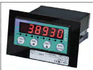
Soporte para etiqueta métrica (Dimensiones: 124 x 77 x 1.5 mm). Support for metric label (dimensions: 124 x 77 x 1.5 mm).