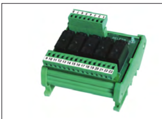
Módulo de 5 relés externo para aumentar la capacidad de los contactos de intercambio de 2 A / 115 Vca. External 5-relay module to increase the capacity of SPDT contacts to 2A/115Vac.