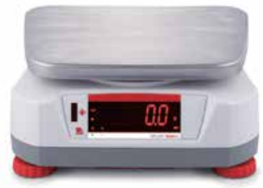
Display trasero con sensor «Touchless» integrado